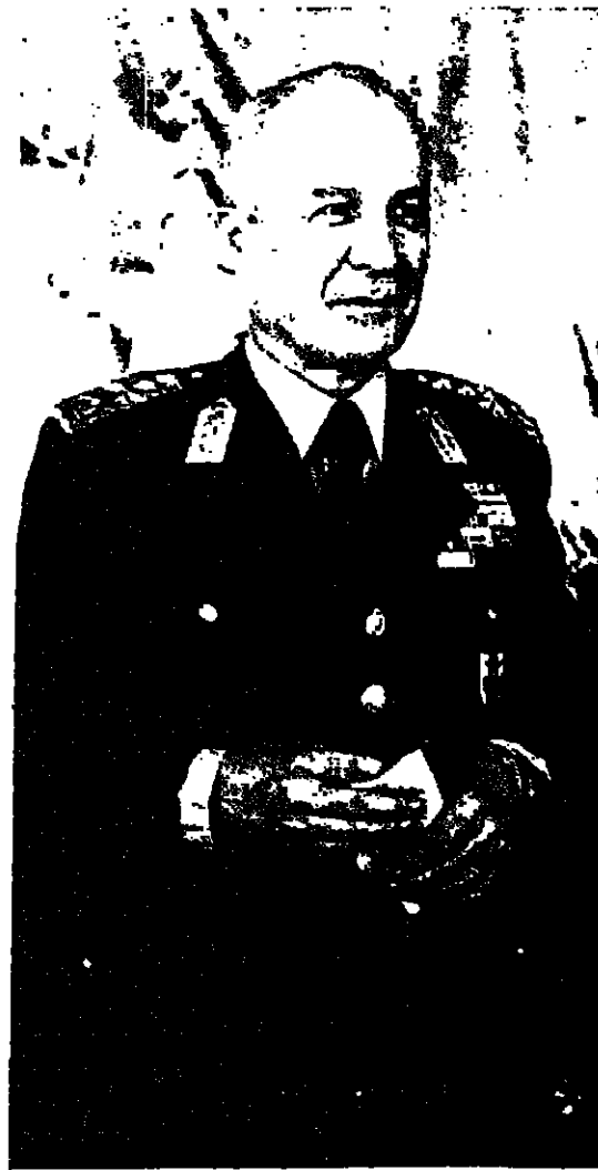
الجنرال اقوين : نقاول أم حذر

تلك هي المطلب التي يوجهها شركة «ال - عال» إلى عمالها بواسطة الضغط عليهم وبساليب رديئة فظة، والتنازل من جميع حقوق العمال، وليس هذا فحسب، بل ان الشركة اعلمت ان مشروع الامتياز ما يزال في طوره الأول، واكتت «ال - حشمار» ان عمال الشركة سيوافقون دون شك على التسليم إلى مشروع تماتش حشمر، ولكن شرط ان يتم توزيع العمه بصورة عادلة، وانه لا يمكن التوصل إلى تعاون حقيقي في تحمل الأعباء دون مشاركة العمال الحقيقية في وضع سياسة وادارة الشركة «ال - عال».